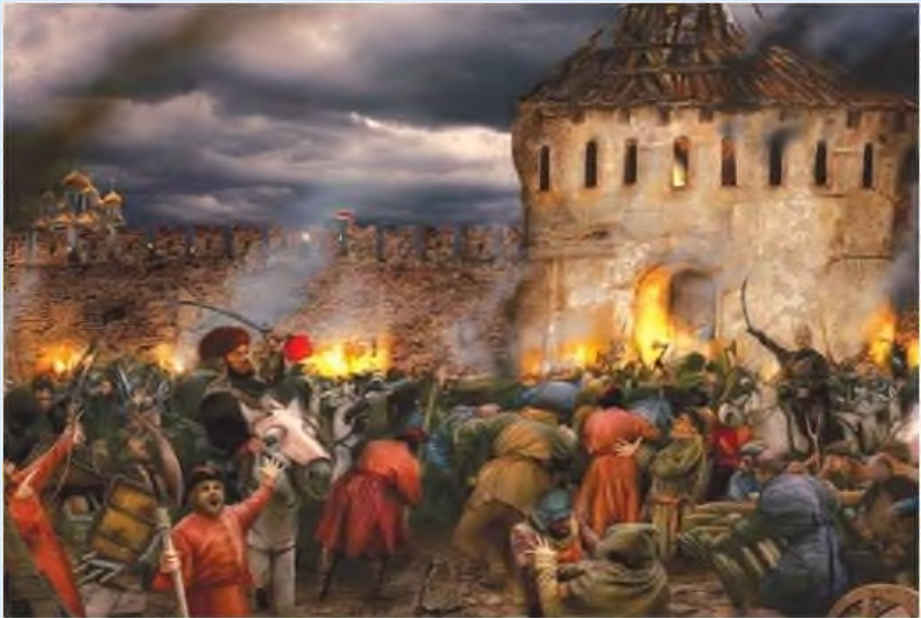
Вход Минина и Пожарского в Китай-город